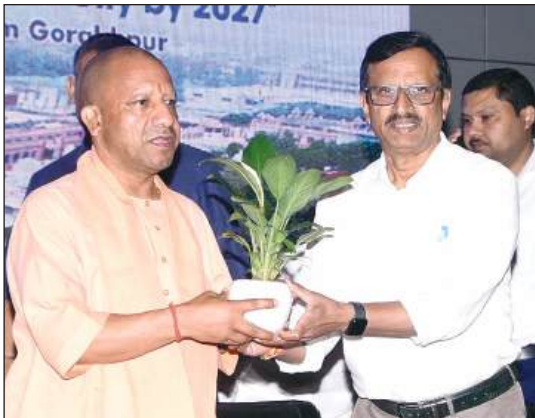
रूप में विकसित करेंगी।

» कार्यालय संवाददाता, स्वराज इंडिया ब्यूरो। गोरखपुर। मुख्यमंत्री योगी आदित्यनाथ ने कहा कि कार्बन उत्सर्जन को न्यूनतम स्तर पर लाने और पर्यावरण संरक्षण के लिए प्रौद्योगिकी और जन जागरूकता के समन्वय से ही अच्छे परिणाम आएंगे। प्रधानमंत्री नरेंद्र मोदी ने वर्ष 2070 तक नेट जीरो का लक्ष्य तय किया है उसमें राष्ट्रीय स्तर से लेकर स्थानीय स्तर तक के कार्यक्रमों को आगे बढ़ाने की आवश्यकता है। इन कार्यक्रमों में जन प्रतिनिधियों के जरिये जन सहभागिता भी होनी चाहिए क्योंकि कोई भी आंदोलन जन सहभागिता के बिना सफल नहीं हो सकता। मुख्यमंत्री ने कहा कि सरकार प्रदेश के सभी नगर निगमों को सोलर सिटी के