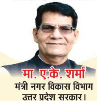
मा. ए.के. शर्मा मंत्री नगर विकास विभाग उत्तर प्रदेश सरकार।