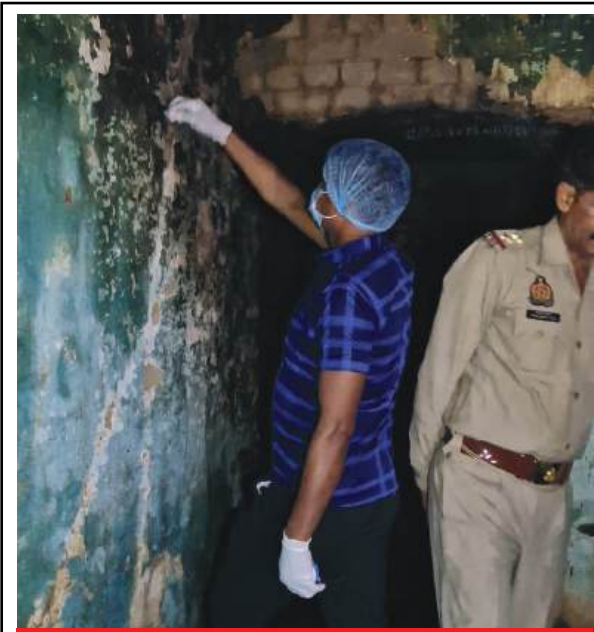
मौके पर जांच करती पुलिस टीम