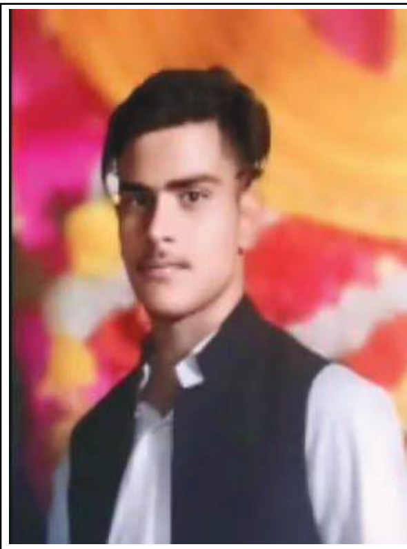
मृतक युवक की फाइल फोटो

वहीं युवक के पिता ने गुमशुदगी की रिपोर्ट दर्ज कराई थी। घटना से एक दिन पहले युवती ने अपने भाई को फोन किया था। भाई ने उसे डांट-फटकार भी लगाई थी। इसके बाद युवती के पिता ने कोतवाली में फोन नंबर की जानकारी दी। पुलिस नंबर को ट्रेस कर जबलपुर के लिए निकली लेकिन इसी दौरान जबलपुर के पनागर थाने से दोनों की आत्महत्या की