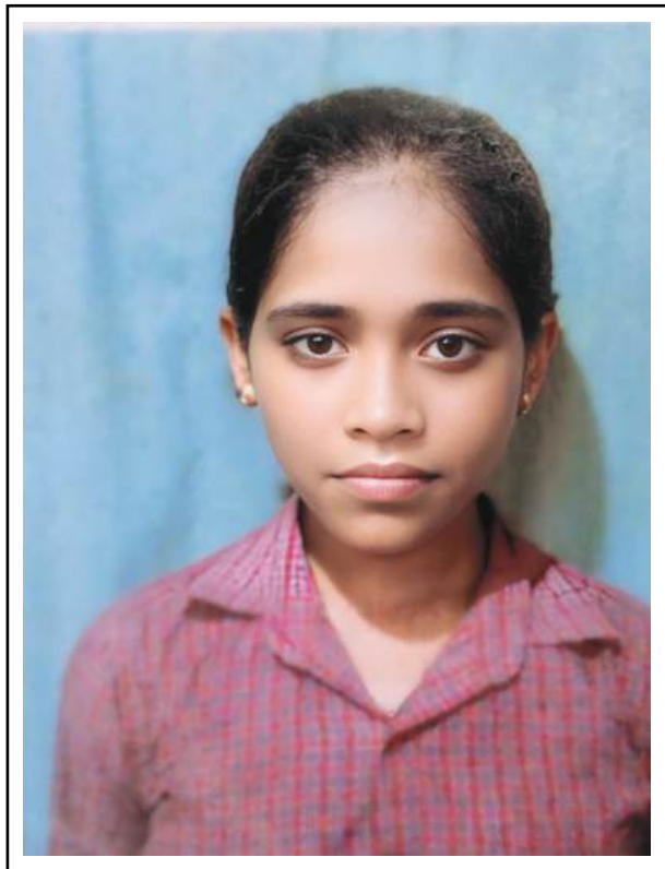
मृतका की फाइल फोटो