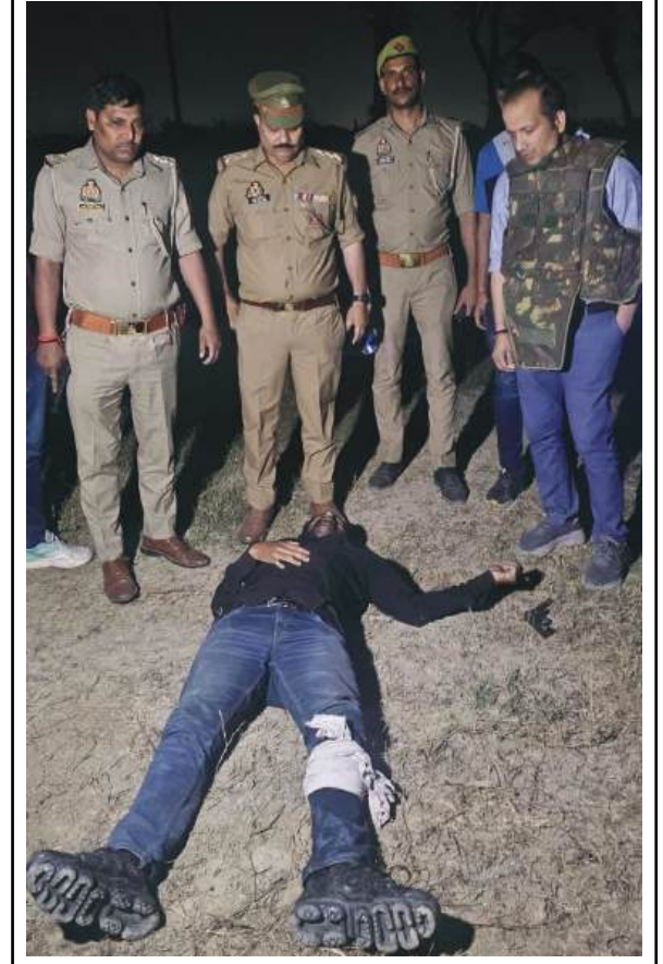
इस्तेमाल होने वाली बाइक बरामद की गई है, इसके अलावा 32 बोर का देशी तमंचा भी बरामद हुआ है। मेडिकल के बाद उससे और पूछताछ की जाएगी।