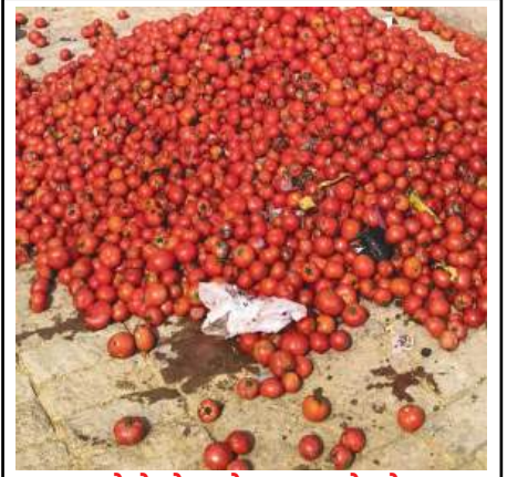
खेतों में लगे टमाटर के ढेर