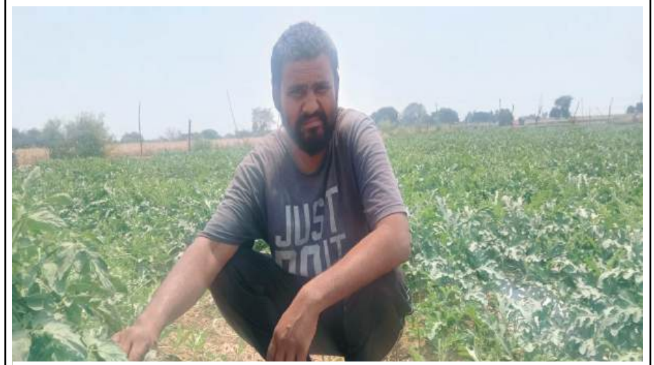
टमाटर की पैदावार इस बार इतनी ज्यादा हुई है किसान अब तोड़ नहीं रहे

10, हजार तक लागत आई थी। आठ बीघा खेत में लगभग 1 लाख रुपये खर्च किये थे। फसल बहुत अच्छी हुई लेकिन भाव उम्मीद से कहीं ज्यादा नीचे चले गए। बाजार में 10 रुपये के तीन किलो टमाटर माइक लगाकर फुटकर में बेचे गए। थोक में कीमत 2 रुपये भी मिलना मुशकिल हो गया। खेत से थोक में फ्री में टमाटर ले जाने वाले खरीदार तक नहीं मिले। खुद खेत से मंडी तक ले जाने का खर्चा और