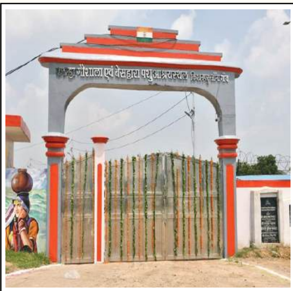
गौशाला प्रदेश की दूसरी गौशाला है, जिसे ISO 9001:2015 (Quality Management System) प्रमाण पत्र प्रदान किया गया है।