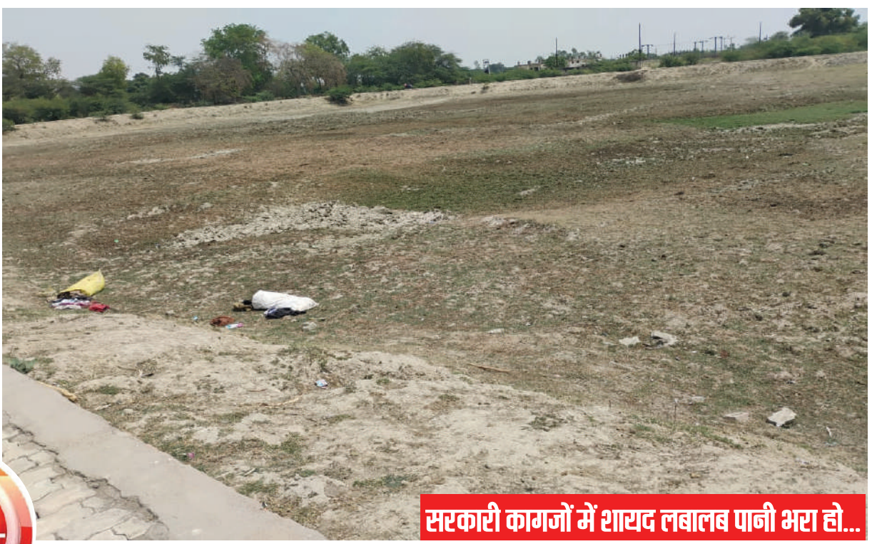
सरकारी कागजों में शायद लबालब पानी भरा हो...

प्यासे पशु-पक्षी फैक्ट्रियों से निकलने वाला जहरीला पानी पीने को मजबूर हैं। स्थानीय प्रशासन इन बेजुबानों की तकलीफ तक नहीं सुन पा रहा।