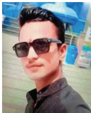
मृतक की फाइल फोटो