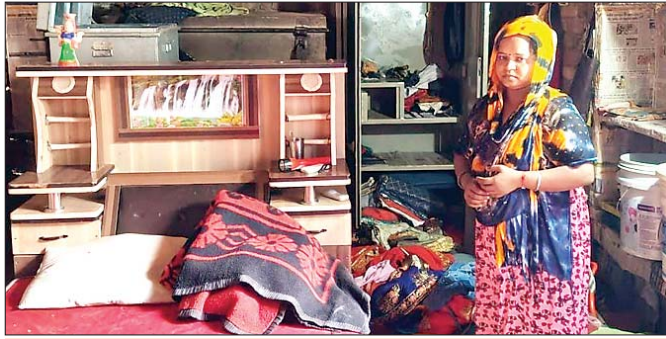
» मेडिकल रिपोर्ट में चोटें मामूली, फोरेंसिक टीम को भी पुख्ता साक्ष्य नहीं मिले, पुलिस कर रही गहराई से जांच