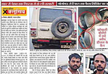
स्वराज इंडिया ने डीजल तस्करी खुलासा पहले भी किया था।

डीजल चोरी का मालगाड़ी से लाया गया माल होता है, जिसे कानपुर से बिठूर, परियर और सफीपुर तक सप्लाई किया जाता है। गाड़ी कई पुलिस चौकियों से होकर गुजरती है, मगर कार्रवाई न होना विभागीय मिलीभगत पर सवाल खड़े करता है। स्थानीय लोगों का कहना है कि जब पुलिसिया चौकियों से अवैध डीजल से भरी गाड़ियां बेरोकटोक निकल रही हों, तो संरक्षण के बिना यह संभव नहीं है।