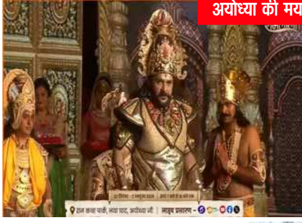
अयोध्या की मर्यादा पर सवाल