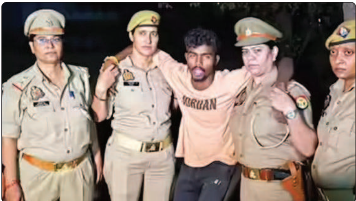
» विशेष संवाददाता, स्वराज इंडिया ब्यूरो।

अब पुलिस पर चलाएगा गोली? हिस्ट्रीशीटर बोला- सॉरी मैडम