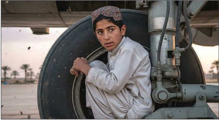
» नई दिल्ली, एजेसी।

1996 की कहानी दोहराई, तब लंदन गए थे दो भाई विमान के पहियों में छुपकर काबुल से दिल्ली पहुंचा 13 वर्षीय किशोर ईरान जाना चाहता था, गलती से आ पहुंचा भारत