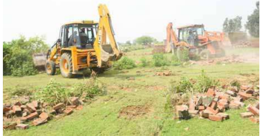
अवैध प्लॉटिंग ध्वस्त करती जेसीबी

अधिकारियों ने बताया कि क्षेत्र में चल रही अन्य अवैध प्लॉटिंग को भी चिन्हित किया जा रहा है, जिन्हें नियमों के तहत जल्द ही ध्वस्त कराया जाएगा। प्राधिकरण ने आमजन से अपील की है कि वह अवैध कॉलोनियों में प्लॉट न खरीदें, क्योंकि ऐसे निर्माण किसी भी समय ध्वस्त किए जा सकते हैं। खरीदारों को न सिर्फ आर्थिक नुकसान होगा, बल्कि उनके खिलाफ कानूनी कार्यवाही भी की जाएगी।