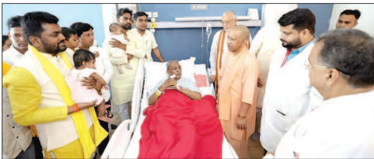
लखनऊ स्थित मेदांता हॉस्पिटल में सीएम योगी ने सुभासपा के राष्ट्रीय अध्यक्ष एवं यूपी सरकार में कैबिनेट मंत्री ओम प्रकाश राजभर से मुलाकात कर कुशल-क्षेम पूछा।

मुख्यमंत्री ने बताया कि विद्यार्थियों के लिए नोटबुक, पेंसिल और अन्य शैक्षणिक सामग्री पर जीएसटी शून्य कर दिया गया है। इसी तरह ज्यादातर घरेलू उपयोग की आवश्यक सामग्रियों को जीरो या 5 प्रतिशत के दायरे में लाया गया है। जीवन रक्षक 33 प्रकार की दवाओं को भी पूरी तरह से जीएसटी से मुक्त कर दिया गया है। उन्होंने कहा कि बाजार में खपत बढ़ने से उत्पादन में वृद्धि हुई है। इससे व्यापारी और उद्यमी दोनों को लाभ हुआ है और युवाओं के लिए रोजगार के नए अवसर खुले हैं। त्योहारों के सीजन में यह बड़ा कदम उपभोक्ताओं के लिए राहत लेकर आया है।