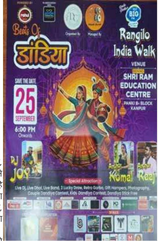
नगर निगम का लोगो लगाए