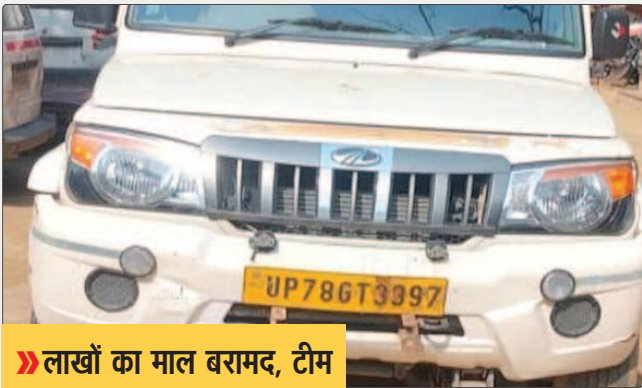
» लाखों का माल बरामद, टीम को 20 हजार इनाम।

इलेक्ट्रॉनिक व बाइक स्पेयर पार्ट्स की दुकान में हुई चोरी का खुलासा