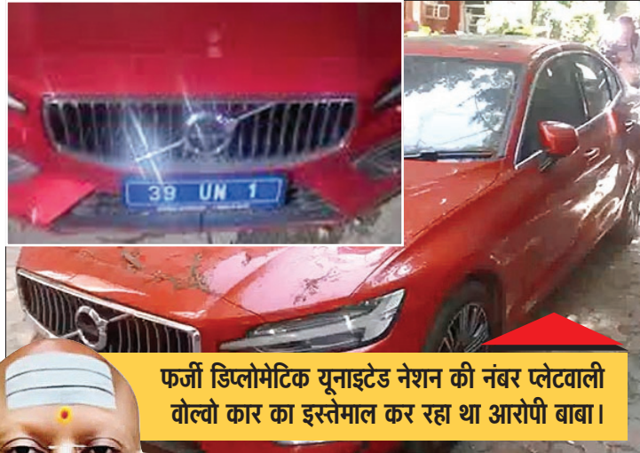
फर्जी डिप्लोमेटिक यूनाइटेड नेशन की नंबर प्लेटवाली वोल्वो कार का इस्तेमाल कर रहा था आरोपी बाबा।

पुलिस ने बीएनएस की धारा 75(2), 79, 351(2) के तहत मामला दर्ज किया और जांच शुरू की। जांच के दौरान सीसीटीवी फुटेज की जांच की गई, घटनास्थल और आरोपी के पते पर छापे मारे गए, लेकिन आरोपी अब तक फरार है। पुलिस ने संस्थान के बेसमेंट में खड़ी एक वोल्वो कार जब्त की, जिस पर फर्जी