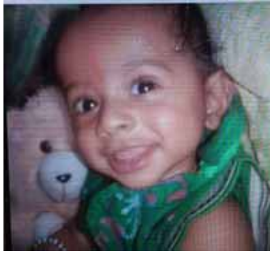
मृतक मासूम राजा की फाइल फोटो

सच्चाई ने सबको चौंका दिया। परिजनों के मुताबिक लोहिया नगर