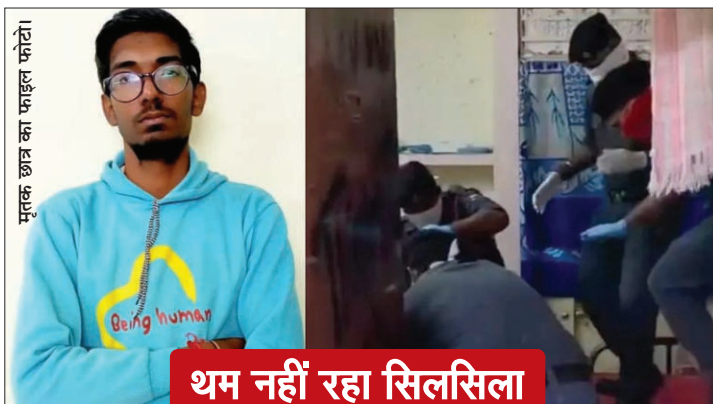
मृतक छात्र का फाइल फोटो

गौरतलब है कि हाल ही में एनएचआरसी कोर्ट ने भी आईआईटी कानपुर को तलब करते हुए पूछा था कि छात्रों की आत्महत्याओं को रोकने के लिए आखिर क्या किया गया? संस्थान ने 18 बिंदुओं की योजनाओं की