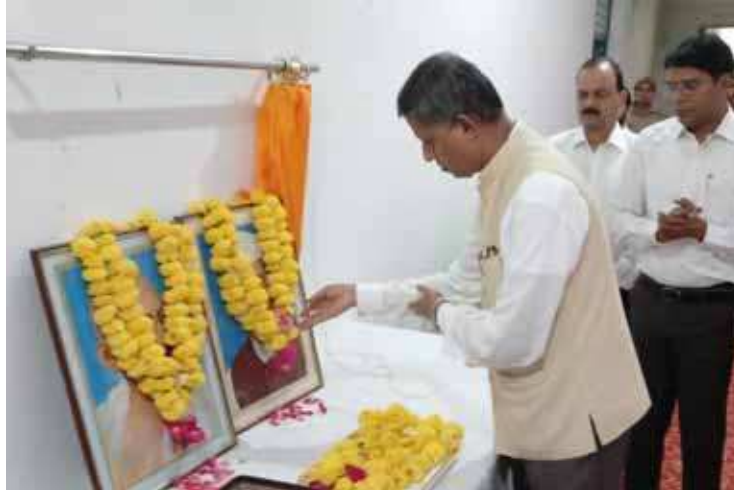
आत्मविश्वास का भाव जगाया।

जिलाधिकारी ने कहा कि गांधी जी के सत्य, अहिंसा और सेवा के सिद्धांत आज भी उतने ही प्रासंगिक हैं, जितने स्वतंत्रता संग्राम के दौरान थे। वहीं, शास्त्री जी की सादगी, ईमानदारी और राष्ट्रभक्ति आज के प्रशासनिक तंत्र के लिए प्रेरणा का स्रोत है। उन्होंने देश को जय जवान, जय किसान का अमर नारा दिया, जिसने आत्मनिर्भरता और