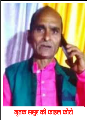
मृतक ससुर की फाइल फोटो