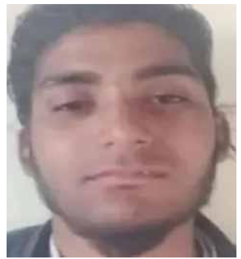
एजेंसियों की निगाह अब उसके नेटवर्क पर

किन-किन संपर्कों में रहा और किस विदेशी नेटवर्क से जुड़ा था।