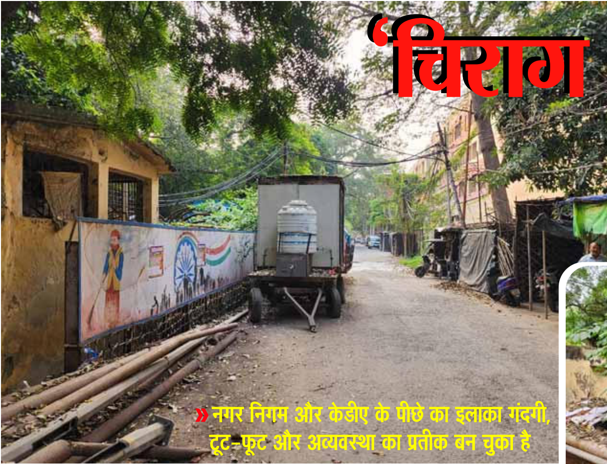
» नगर निगम और केडीए के पीछे का इलाका गंदगी, टूट-फूट और अव्यवस्था का प्रतीक बन चुका है