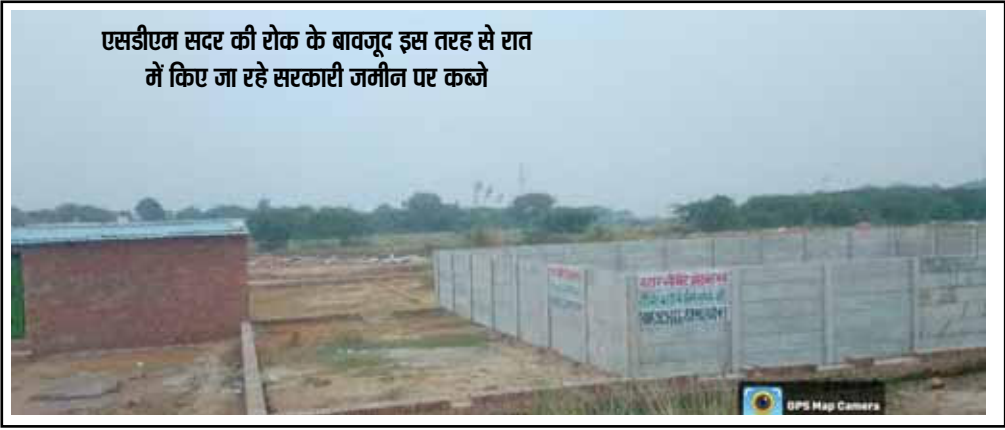
एसडीएम सदर की रोक के बावजूद इस तरह से रात में किए जा रहे सरकारी जमीन पर कब्जे