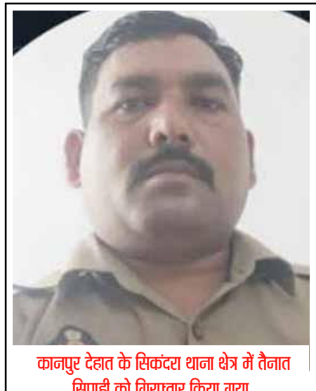
कानपुर देहात के सिकंदरा थाना क्षेत्र में तैनात सिपाही को गिरफ्तार किया गया

स्टेटस सिंबल बनती जा रही है, जिससे युवा अफसर भी बच नहीं पा रहे हैं। वह युवा जो देश व समाज सेवा की नीयत से यूनिफॉर्म पहनते हैं, वे भी भ्रष्टाचार की उसी दलदल में फँस रहे हैं जिससे पुलिस छवि सालों से जूझ रही है।