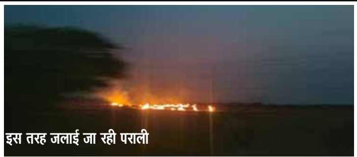
इस तरह जलाई जा रही पराली

» किसानों को नोटिस के बावजूद नहीं रुक रहा पराली जलाना