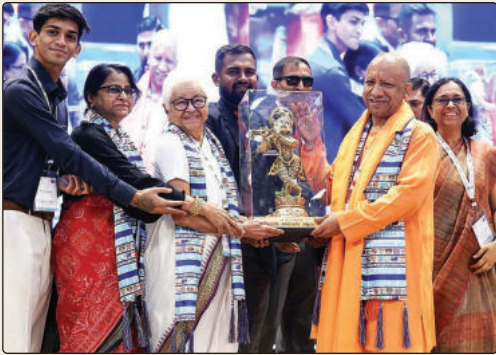
» वरिष्ठ संवाददाता, स्वराज इंडिया।

विश्व के मुख्य न्यायाधीशों का सम्मेलन: योगी सरकार ने किया भव्य स्वागत, ताजमहल देखकर मंत्रमुग्ध हुए मेहमान