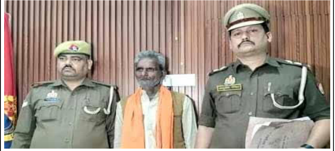
दौरान मिले सहयोग और पहचान बदलने की प्रक्रिया की भी जांच कर रही है।

इस महत्वपूर्ण गिरफ्तारी के लिए पुलिस टीम को 25 हजार रुपये का इनाम दिया जाएगा। पुलिस अब आरोपी के पुराने नेटवर्क, उसके फरारी के