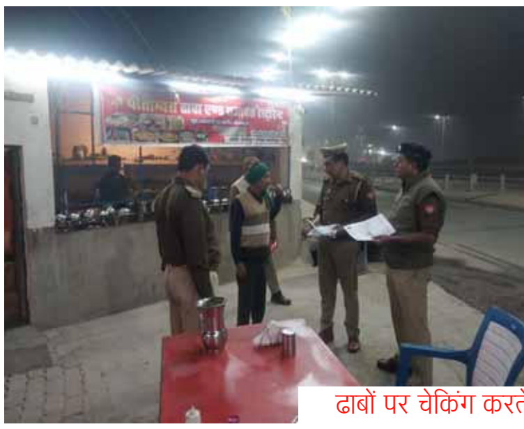
ढाबों पर चेकिंग करते पुलिस अधिकारी

एसपी के निर्देश पर रात भर चला अभियान, 96 ढाबा संचालकों को नोटिस दी गई