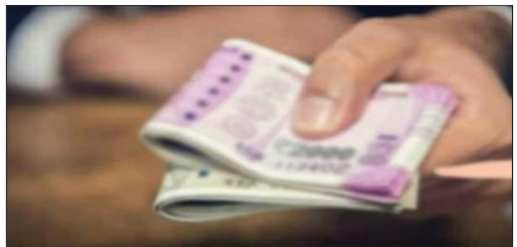
» स्वराज इंडिया न्यूज ब्यूरो।

बाजार में तनाव, पुलिस और भाजपाइयों में तकरार