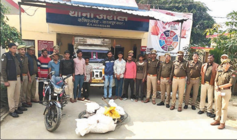
» स्वराज इंडिया न्यूज ब्यूरो।

‘बिजली के डॉक्टर’ निकले अंधेरे के डॉन, लाइनमैन समेत नौ गिरफ्तार