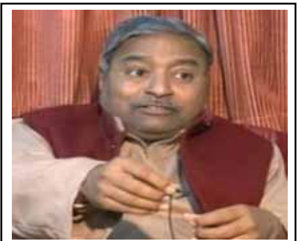
पूर्व सांसद विनय कटियार

सांसद की यह पीड़ा बताती है कि धर्मध्वजा का मंच तो एक है, पर राजनीति कई पटरी पर भाग रही है। आज का दिन इतिहास में दर्ज होगा और सियासत में भी एक तरफ सोने से मढ़ा 161 फीट शिखर, दूसरी ओर नेताओं की तलखियां, उपेक्षा और आरोप। अयोध्या में आज धर्मध्वजा फहराएगी, लेकिन सोमवार को जो बयान उड़े उन्होंने दिखा दिया कि धार्मिक आस्था जितनी ऊंची होती है, राजनीति उसके आसपास उतनी ही तीखी घूमती है।