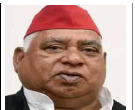
वर्तमान सांसद अवधेश प्रसाद सपा