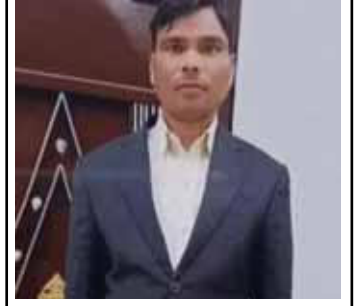
मृतक लेखपाल की फाइल फोटो