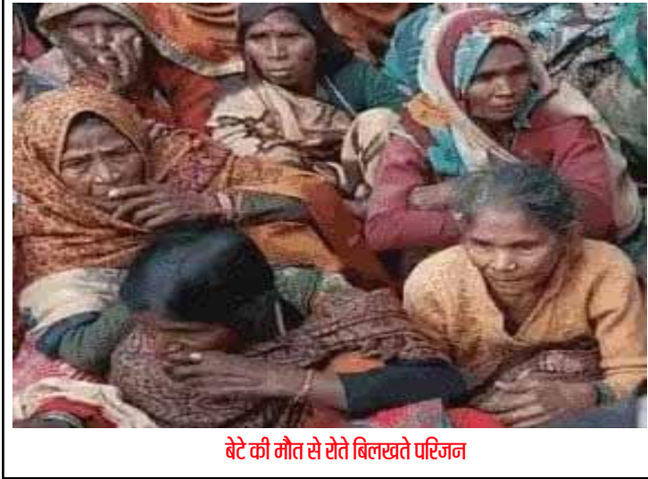
बेटे की मौत से रोते बिलखते परिजन