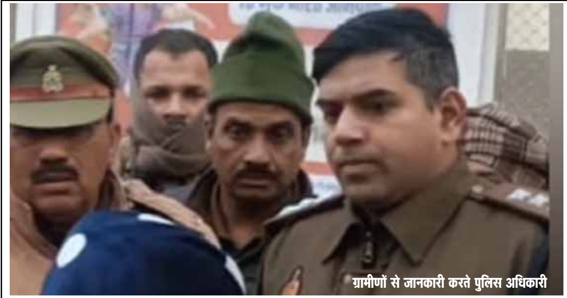
ग्रामीणों से जानकारी करते पुलिस अधिकारी