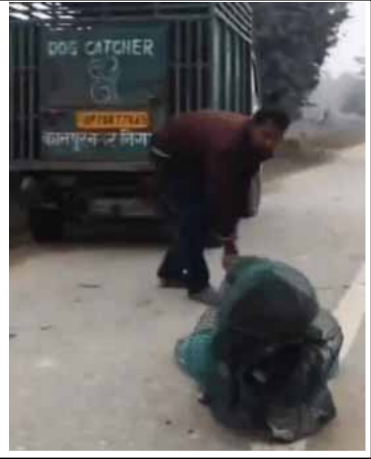
» प्रमुख संवाददाता/स्वराज इंडिया

कुत्ते के काटने के मामले बढ़े, सुप्रीम कोर्ट के निर्देश पर नगर निगम ने बढ़ाई नसबंदी की रफ्तार