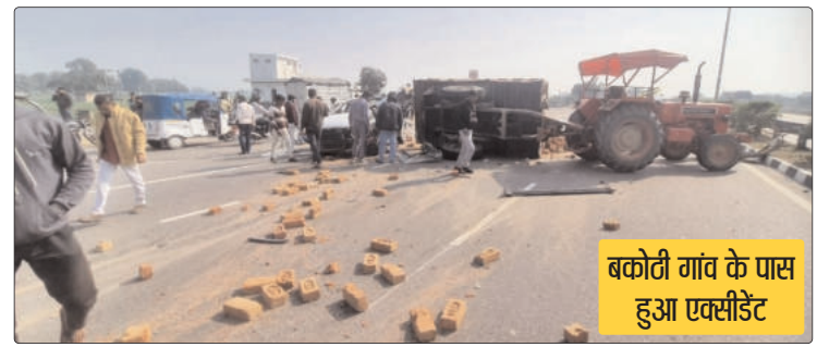
बकोटी गांव के पास हुआ एक्सीडेंट

पुलिस के अनुसार दोनों युवक काम के सिलसिले में कानपुर जा रहे थे। हादसे के बाद ट्रैक्टर-ट्रॉली से बिखरी ईंटों के कारण हाईवे