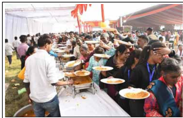
का कहना है कि आगे की जांच जारी है और दोषी पाए जाने वालों पर कार्रवाई

हालांकि अब तक टेंडर प्रक्रिया और भुगतान से जुड़े बिंदुओं की विस्तृत जांच नहीं हुई है, लेकिन प्रारंभिक निष्कर्ष भ्रष्टाचार और लापरवाही की ओर साफ इशारा कर रहे हैं। प्रशासन