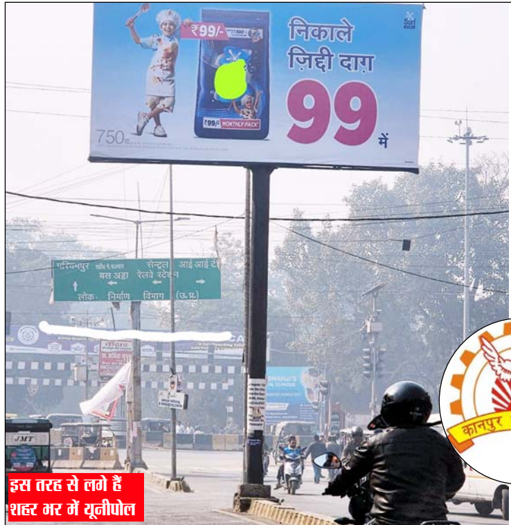
इस तरह से लगे हैं शहर भर में यूनीपोल

स्मार्ट सिटी प्रोजेक्ट से लगाए शहर में यूनीपोल के टेंडर आवंटन में छिपी बड़ी धोखाधड़ी