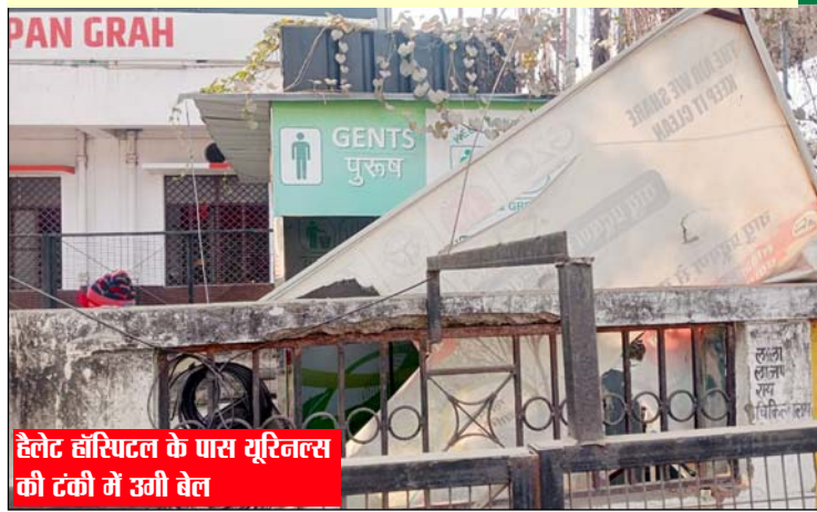
हैलेट हॉस्पिटल के पास यूरिनल्स की टंकी में उगी बेल