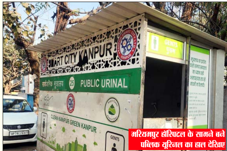
मरियमपुर हॉस्पिटल के सामने बने पब्लिक यूरिनल का हाल देखाए