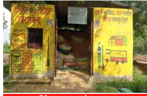
तुर्कमऊ गांव का सेंटर बंद पड़ा

प्रत्येक आरआरसी सेंटर पर लगभग 5 लाख रुपये खर्च किए गए। इस तरह जनपद में करोड़ों रुपये जनता के पैसे से खर्च कर दिए गए, लेकिन न तो गांव साफ हुए, न जैविक खाद बनी और न ही कचरे का वैज्ञानिक निस्तारण शुरू हो पाया। योजना के अनुसार गांवों से निकलने वाले कचरे