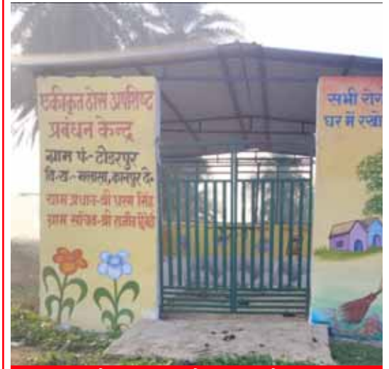
टोडरपुर गांव में बंद पड़ा सेंटर