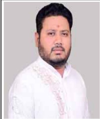
नाला निर्माण को लेकर लेटर नगर आयुक्त को दे कर अवगत करा दिया गया है फाइल बन चुकी है फाइल सेंशन होने के बाद बहुत जल्दी कार्य होगा

केवल लक्ष्मी पुरवा ही नहीं, बल्कि जोन 1 के कई अन्य वार्डों में भी सफाई व्यवस्था बर्दाहल है। नालों की समय से