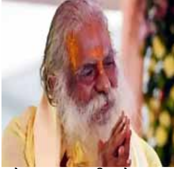
उन्हें तत्काल लखनऊ स्थित मेदांता