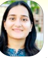
अक्टूबर 2024 - पीएचडी छात्रा प्रगति