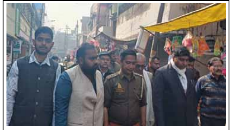
अपर जिला जज अन्य अधिकारियों के साथ निकले