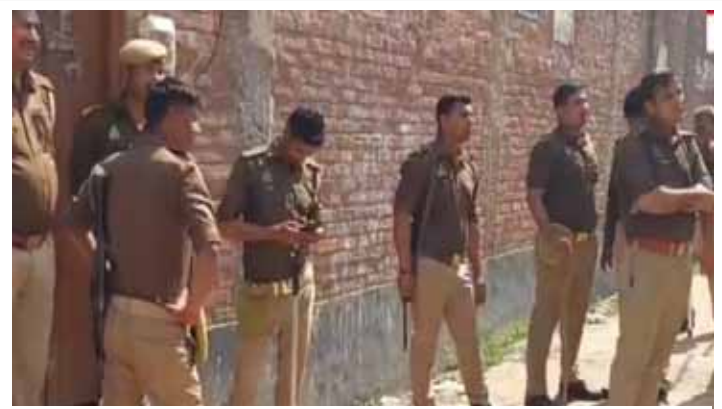
गोदाम के बाद खड़ा फोरस

14(1) के तहत कुर्की के आदेश जारी किए। प्रशासनिक टीम ने डुगडुगी पिटवाकर पहले आरोपी का आवासीय मकान सील किया,