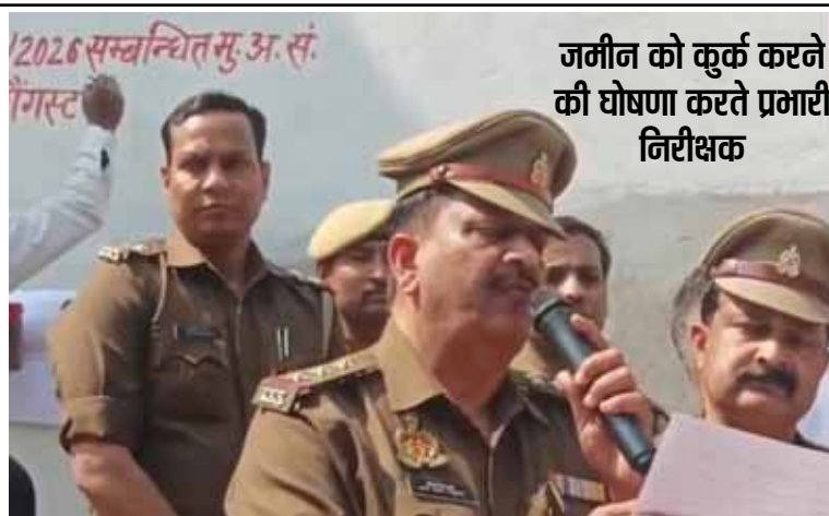
जमीन को कुर्क करने की घोषणा करते प्रभारी निरीक्षक

डुगडुगी पिटवाकर मकान व गोदाम जब्त, 16 मार्च तक मांगे वैध दस्तावेज