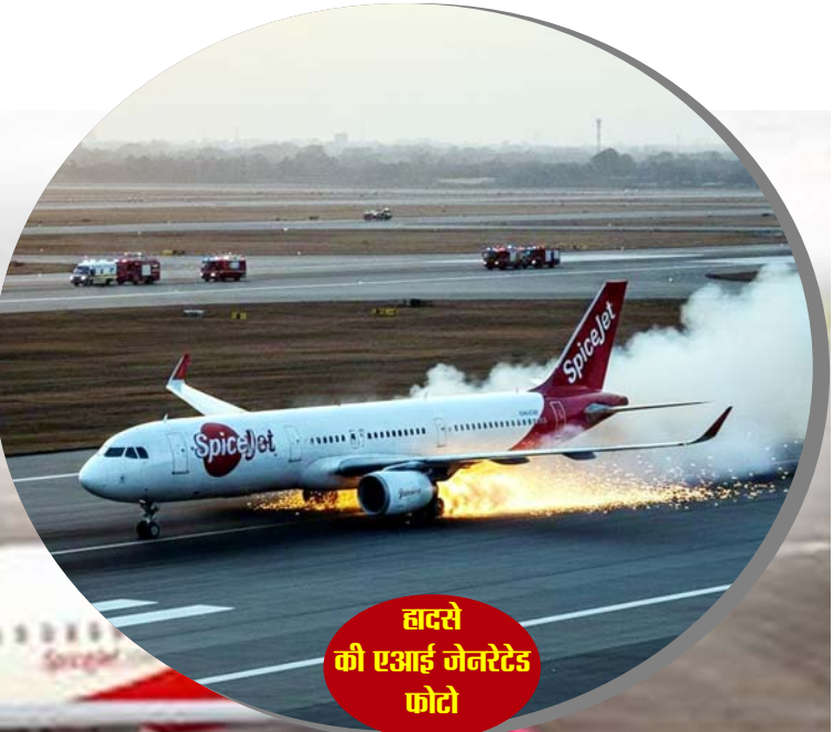
हादसे की एआई जेनरेटेड फोटो

जनवरी 2020 - एयर इंडिया, दिल्ली-लेह तकनीकी खराबी के चलते टेकऑफ के बाद वापसी, यात्रियों को दूसरी उड़ान से भेजा गया।