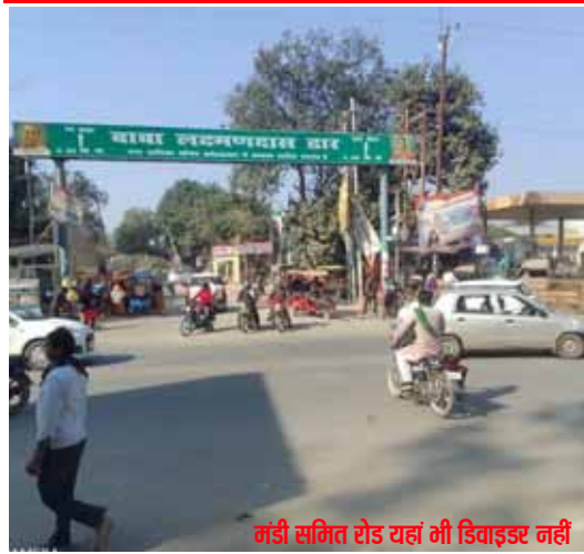
बड़ी समित रोड यहां भी डिवाइडर नहीं

30 दिन में आधा दर्जन दुर्घटनाएं, प्रशासन बेपरवाह