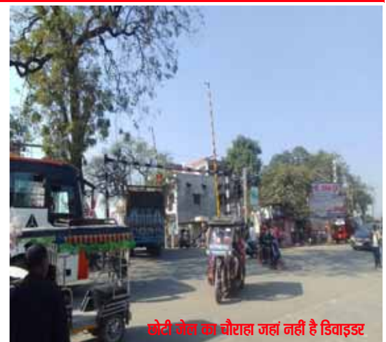
छोटी जेल का चौराहा जहां नहीं है डिवाइडर