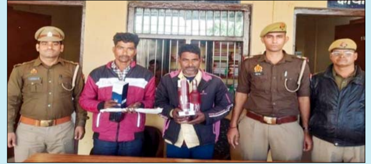
अरौल में शराब दुकान चोरी के मामले में गिरफ्तार दोनों आरोपी

उधर, अरौल थाना क्षेत्र में चार फरवरी की रात अंग्रेजी शराब व बीयर की कंपोजिट दुकान में हुई चोरी की घटना का भी पुलिस ने सफल अनावरण कर दिया। चोरों ने दुकान का शटर काटकर नकदी और शराब की पेटियां चोरी कर ली थी। पुलिस ने सीसीटीवी फुटेज और मुखबिर की सूचना के आधार पर जीटी रोड से ठेके की ओर जाने वाले रास्ते से दो सदिग्धों को गिरफ्तार किया। तलाशी के दौरान आरोपियों के पास से चोरी की शराब की बोतलें, नकदी तथा वारदात में प्रयुक्त लोहे की सरिया और पेंचकस बरामद किए गए। पूछताछ में दोनों आरोपियों ने चोरी की घटना स्वीकार कर ली। पुलिस ने दोनों मामलों में आरोपियों को न्यायालय में पेश कर जेल भेज दिया है।