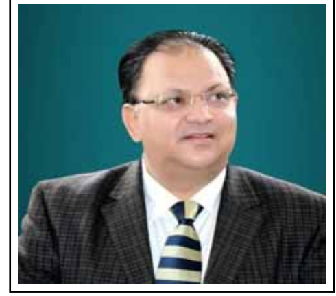
(लेखक वरिष्ठ स्तंभकार व विदेशी मामलों के एक्सपर्ट हैं)

भारत और अमेरिका के बीच हुआ अंतरिम व्यापार समझौता सरकार द्वारा एक बड़ी उपलब्धि के रूप में प्रस्तुत किया जा रहा है। इस दावे में आंशिक सच्चाई अवश्य है, विशेषकर इसलिए कि इस चरण में भारत अपने किसानों और दुग्ध उत्पादकों के हितों को सुरक्षित रखने में सफल रहा है। हालांकि इस समझौते का वास्तविक महत्व आगामी मार्च में सामने आने वाले अंतिम मसौदे के बाद ही पूरी तरह स्पष्ट हो सकेगा।