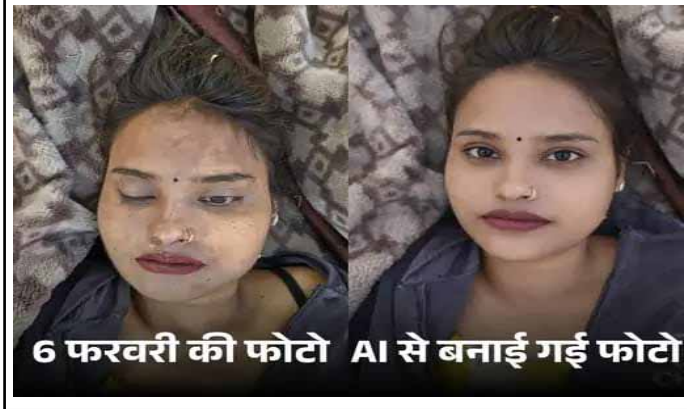
6 फरवरी की फोटो AI से बनाई गई फोटो

महिला के बिगड़े चेहरे को एआई तकनीक से दोबारा तैयार कराया गया।