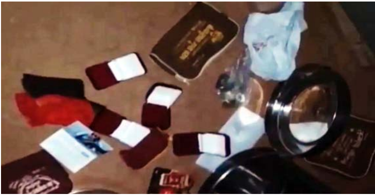
चोरी के बाद घर में बिखरा सामान

पशुपालक को कमरे में बंद कर दी गोली मारने की धमकी, गांव में दहशत