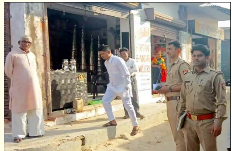
चोरी की सूचना पर जांच करने पहुंची पुलिस

अरौल इस्पेक्टर जनार्दन यादव ने बताया कि बर्तन की दुकान से करीब 25 हजार रुपये की नकदी चोरी हुई है। कुछ लोग भ्रामक सूचना फैला रहे हैं कि ज्वेलरी की दुकान में