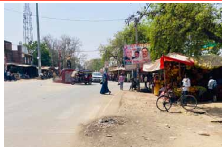
गजनेर चौराहा शौचालय बिना अधूरा

सार्वजनिक शौचालय जैसी अनिवार्य सुविधा का अभाव यात्रियों के लिए निरंतर असुविधा और परेशानी का कारण बना हुआ है। उल्लेखनीय है कि गजनेर कस्बा जनपद की सबसे बड़ी गल्ला मंडी के रूप में सुविख्यात है, जहां प्रत्येक बुधवार व शनिवार को विशाल बाजार का आयोजन होता है। इन दिनों आसपास के अनेक गांवों से व्यापारी व ग्राहक बड़ी संख्या में ऋय-विक्रय के लिए पहुंचते हैं, जिससे चौराहे पर भीड़ का असाधारण