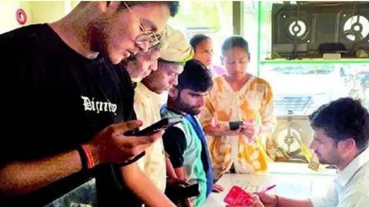
चौबेपुर में ई-केवाईसी के लिए प्रपत्र जमा करते उपभोक्ताओं की उमड़ी भीड़।

ई-केवाईसी न होने से बढ़ी परेशानी, एजेंसी पर दिनभर लगी रही भीड़