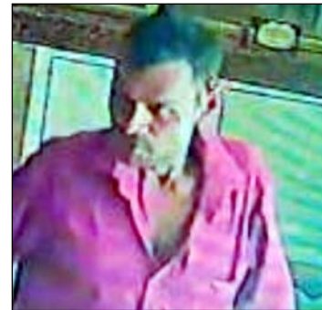
सीसीटीवी में कैद आरोपी।

घटना की जानकारी मिलते ही बड़ी संख्या में ग्रामीण मंदिर परिसर में जुट गए और नाराजगी जताई। लोगों ने आरोपी की जल्द गिरफ्तारी और मंदिर की सुरक्षा व्यवस्था