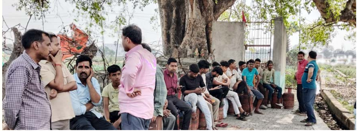
बिल्हौर में गैस सिलिंडर लेने के सुबह से लगी लंबी कतार में खड़े उपभोक्ता।

इसका सीधा असर डिस्पैच प्रक्रिया पर पड़ रहा है, जिससे रिफिलिंग प्लांट से सिलिंडर की आपूर्ति प्रभावित हो रही है। वहीं, उच्चला