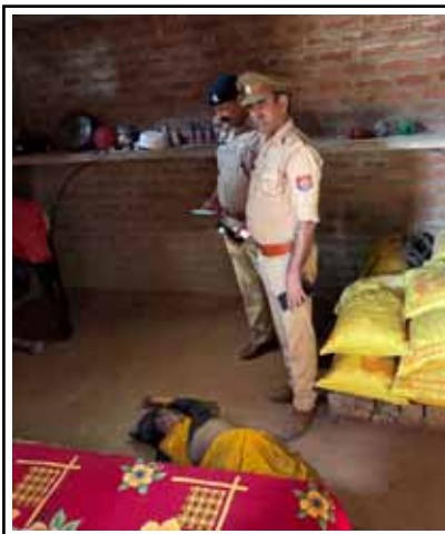
गुरुवार सुबह घटना की सूचना मिलते ही डेरापुर थाना पुलिस मौके पर पहुंची। खून से

वह लहलुहान होकर जमीन पर गिर पड़ी और कुछ ही देर में उसकी सांसें थम गईं। घर के भीतर हुई इस खौफनाक वारदात की भनक जब ग्रामीणों को लगी तो गांव में सनसनी फैल गई।