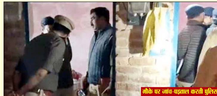
मौके पर जांच-पड़ताल करती पुलिस