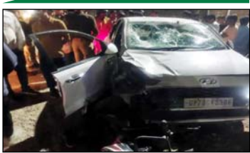
हादसे के बाद क्षतिग्रस्त कार