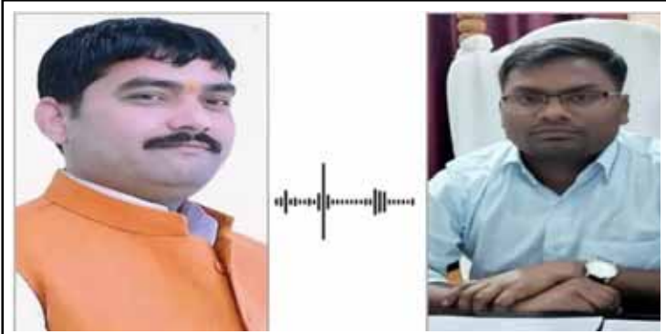
ऑडियो सत्ता के अहंकार और प्रशासनिक मजबूरी की भयावह तस्वीर पेश करता है।