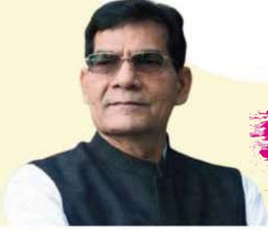
श्री ए० के० शर्मा, नगर विकास मंत्री