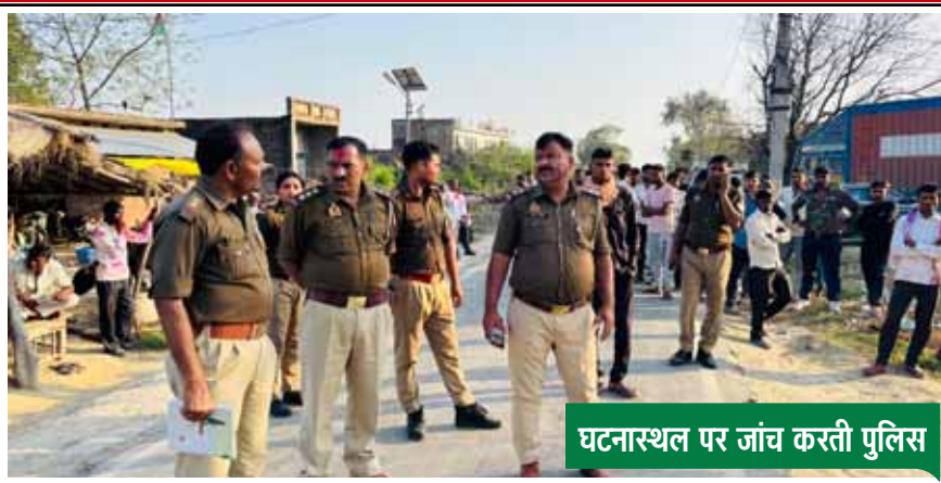
घटनास्थल पर जांच करती पुलिस

गुरुग्राम में पति की 1 मार्च को संदिग्ध परिस्थितियों में फांसी लगाकर मौत हो गई थी