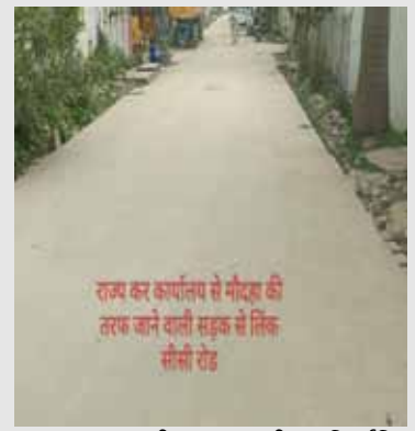
राज्य कर कर्याण से मोटर की तरफ जाने वाली सड़क से निकल सीसी रोड

हैरानी की बात यह है कि सीसी रोड बने हुए दो से तीन माह बीत चुके हैं, लेकिन नाली निर्माण अब तक शुरू नहीं हुआ। जबकि अनुबंध के अनुसार