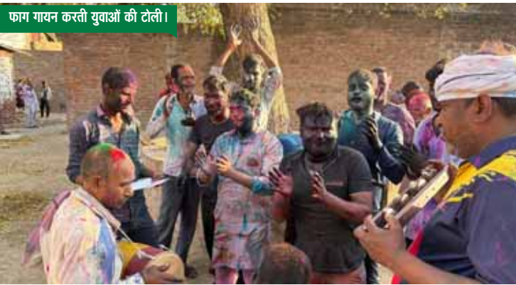
फाग गायन करती युवाओं की टोली।

गांवों में देर शाम तक रंग की बौछार और गुलाल उड़या जाता रहा। गांवों में फाग की टोलियां निकलती रहीं। जिसमें डोलक की थाप पर भावै न भवन जिया जरि जरि जाए बालम परदेशवा में। आ जाओ कन्हैया रंग भरके पिचकारी खेलें हम हेरी। बाज रही पैजनियां छमा छम बाज रही पैजनियां.. आदि अवधी, बुंदेली तर्ज पर फाग गायन कर मस्ती में झूमते रहे।