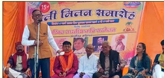
मंच से काव्य पाठ पढ़ते कवि।