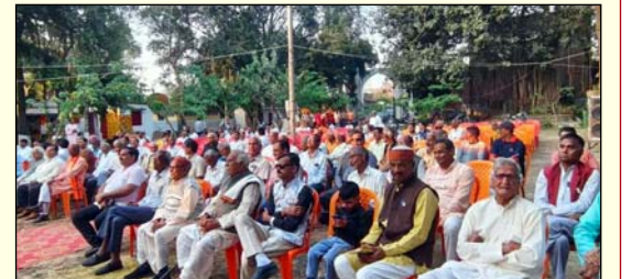
होली मिलन समारोह में उपस्थित नगरवासी।