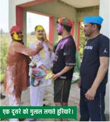
एक दूसरे को गुलाल लगाते हरियारे।

रंगोत्सव पर चढ़ा फगुनियां रंग, टोली में डोलक की थाप पर फाग गायन करते रहे लोग