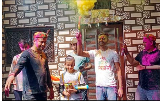
कुछ इस अंदाज में होली के रंग खेलते लोग।