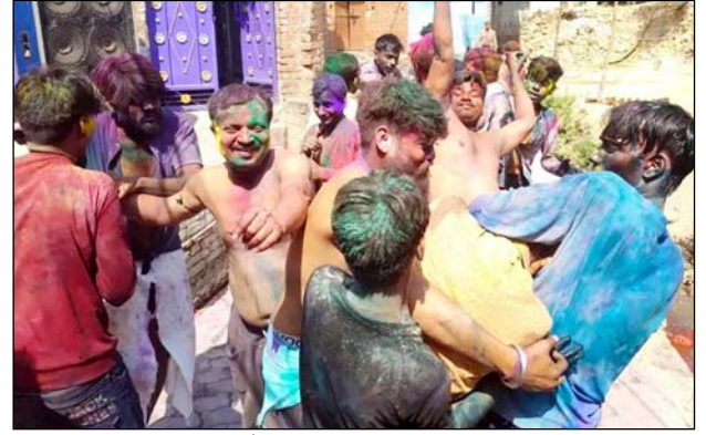
डीजे की धुन पर झूमते और नाचते युवा।