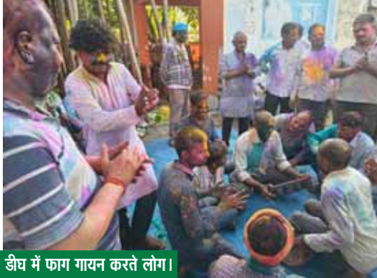
झीघ में फाग गायन करते लोग।

तेरी बरसे रस की धार आज बरसाने हेरी रे, आए खेलन नंद कुमार बरसाने हेरी रे। सहित फाग गायन किए जाते रहे। टोलियों पर रंगों की बौछार की जाती रही। शहर कस्बा समेत गांवों में शुक्रवार को दिनभर होली की मस्ती रही। पुखरायां कस्बा में जहां हरियारे