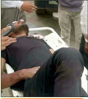
→ केमिकल रंगों से आंखें हुई जख्मी, सड़क हादसों में कई लोगों के सिर फूटे