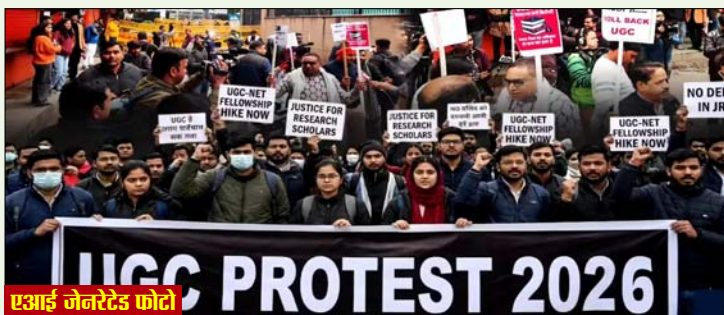
एआई जेनरेटेड फोटो

नई दिल्ली/लखनऊ। विश्वविद्यालय अनुदान आयोग (यूजीसी) द्वारा जारी किए गए 'समानता नियम-2026' को लेकर देशभर में विरोध तेज हो गया है। सवर्ण समाज से जुड़े विभिन्न संगठनों और कई सामाजिक मंचों ने इन नियमों को लेकर राष्ट्रव्यापी आंदोलन का ऐलान किया है। इसी कड़ी में 8 मार्च (रविवार) को दिल्ली के रामलीला मैदान में प्रस्तावित बड़ी रैली से पहले ही प्रशासन ने कई स्थानों पर एहतियाती कार्रवाई की। उत्तर प्रदेश के बुलंदशहर, हाथरस समेत कुछ अन्य जिलों में आंदोलन से जुड़े कई नेताओं और कार्यकर्ताओं को घरों में ही नजरबंद (हाउस