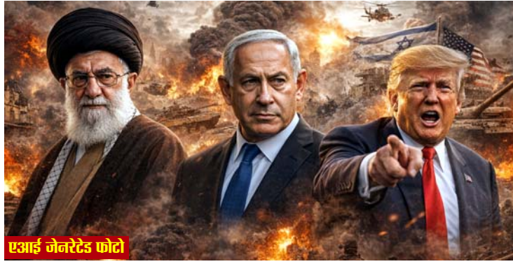
एआई जेनरेटेड फोटो

माने जाते रहे हैं और उनका संबंध देश की शक्तिशाली सैन्य संस्था आईआरजीसी से भी गहरा माना जाता है।