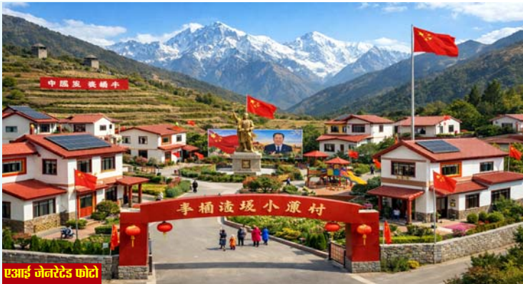
एआई जनरेटड फोटो