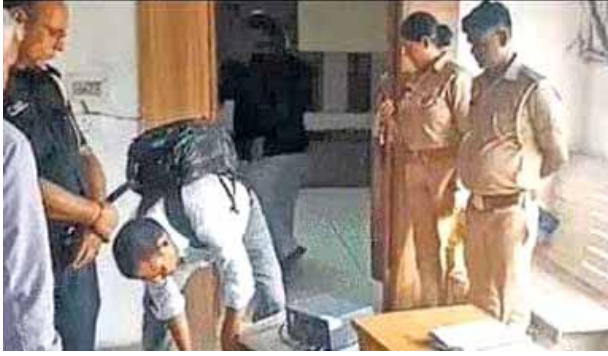
वकीलों के साथ नगर निगम मुख्यालय पहुंचे।

लखनऊ। बकाये भुगतान के विवाद में लखनऊ के लालबाग स्थित नगर आयुक्त कार्यालय में सिविल कोर्ट के आदेश पर कुर्की की कार्रवाई शुरू होते ही निगम मुख्यालय में हड़कंप मच गया। पुलिस और न्यायालय के अमीन की टीम अचानक पहुंची और कार्यालय का सामान बाहर निकालना शुरू कर दिया, जिससे अफसरों और कर्मचारियों के बीच तीखी बहस हो गई। कुर्की की प्रक्रिया के लिए हजरतगंज पुलिस और कोर्ट के अमीन वादी संस्था के