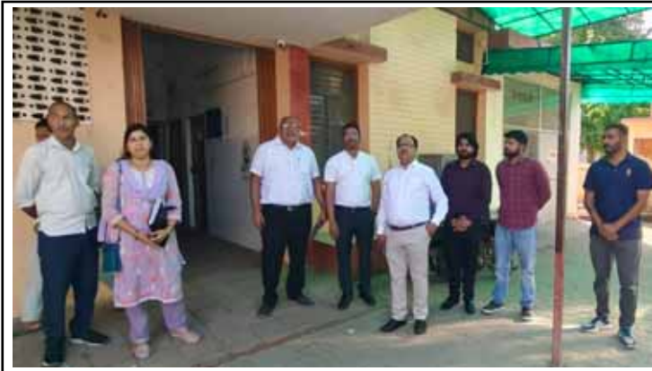
स्वच्छ और सुरक्षित वातावरण उपलब्ध कराना प्रशासन की प्राथमिक जिम्मेदारी है और इसमें किसी भी प्रकार की लापरवाही स्वीकार नहीं की जाएगी। निरीक्षण के दौरान ओपीडी और वाडों की स्थिति का जायजा लेते हुए सीएमओ ने चिकित्सकों को चेतावनी दी कि उपचार में

कानपुर देहात। जिले की स्वास्थ्य सेवाओं की जमीनी हकीकत उस समय उजागर हो गई, जब मुख्य चिकित्सा अधिकारी (सीएमओ) डॉ. एके सिंह ने राजपुर प्राथमिक स्वास्थ्य केंद्र (पीएचसी) का औचक निरीक्षण किया। निरीक्षण के दौरान अस्पताल परिसर में व्याप्त गंदगी और अव्यवस्थाओं ने स्वास्थ्य तंत्र की कार्यप्रणाली पर गंभीर सवाल खड़े कर दिए। सीएमओ के पहुंचते ही अस्पताल में कई स्थानों पर गंदगी और लापरवाही के दृश्य सामने आए। इस पर उन्होंने संबंधित कर्मचारियों को कड़ी फटकार लगाई और साफ-सफाई व्यवस्था में तत्काल सुधार के निर्देश दिए। उन्होंने स्पष्ट कहा कि मरीजों को