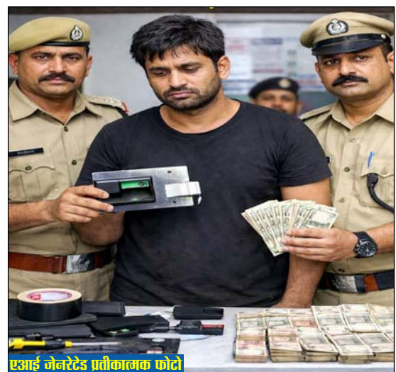
एआई नोन्रेटेड प्रतीकात्मक फोटो