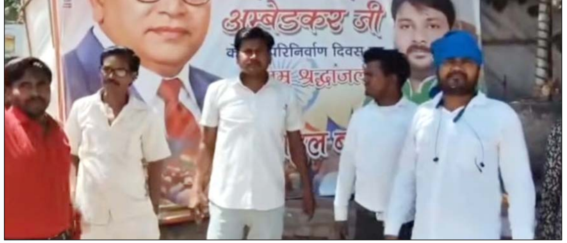
विरोध कर नारेबाजी करते भीम आर्मी के पदाधिकारी व कार्यकर्ता

जरिए विधायक पर निशाना साधा। उन्होंने कहा कि इस तरह की गलती अस्वीकार्य है और ऐसे मामलों में जिम्मेदार लोगों के खिलाफ कार्रवाई होनी चाहिए। उन्होंने आरोप लगाया कि विधायक को बाबा साहब के जीवन से जुड़े महत्वपूर्ण तथ्यों की जानकारी तक नहीं