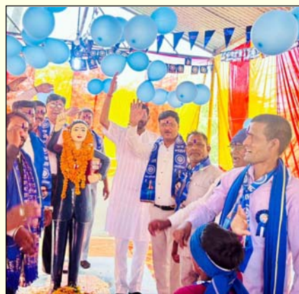
श्रद्धांजलि अर्पित की और उनके आदर्शों को अपनाने का आह्वान किया।