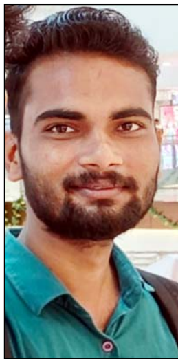
मृतक की फाइल फोटो

कानपुर। कल्याणपुर क्षेत्र में मंगलवार को बीएससी द्वितीय वर्ष के एक छात्र ने फांसी लगाकर आत्महत्या कर ली। घटना की जानकारी उस समय हुई जब साथ रहने वाला दोस्त सुबह उसे जगाने पहुंचा, लेकिन दरवाजा अंदर से बंद मिला। काफी देर खटखटाने के बाद भी कोई प्रतिक्रिया न मिलने पर खिड़की से झांकर देखा गया, जहां छात्र का शव पंखे से लटका मिला।