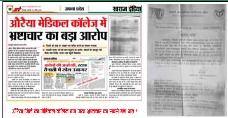
औरैया जिले का मेडिकल कॉलेज बन गया भ्रष्टाचार का सबसे बड़ा गढ़ !

मामले में जिला प्रशासन और स्वास्थ्य विभाग की भूमिका पर भी सवाल उठ रहे हैं। आरोप है कि जिला स्तर के अधिकारी पूरे प्रकरण पर चुप्पी साधे हुए हैं,