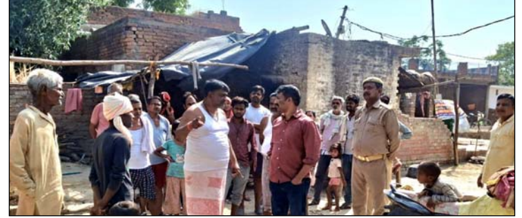
ग्राम प्रधान पति से जानकारी लेते तहसीलदार