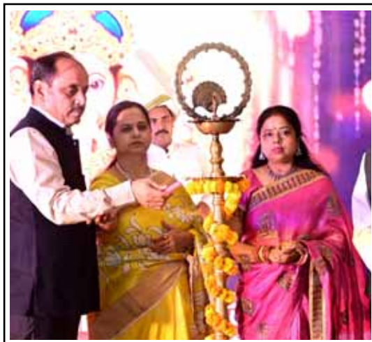
» स्वराज इंडिया न्यूज़ ब्यूरो

बालिका सशक्तिकरण अभियान-2026 के जरिए बेटियों को मिलेंगे नए पंख