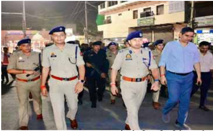
» स्वराज इंडिया न्यूज़ ब्यूरो

» डीआईजी ने डीग गेट, दरेसी रोड, भरतपुर गेट, घिया मंडी रोड, मंडी रामदास रोड तथा श्रीकृष्ण जन्मस्थान मंदिर के आसपास के क्षेत्रों में भ्रमण कर सुरक्षा का जायजा लिया