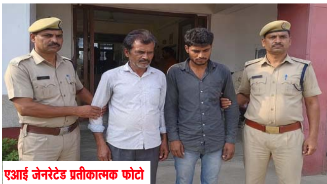
एआई जेनरेटेड प्रतीकात्मक फोटो