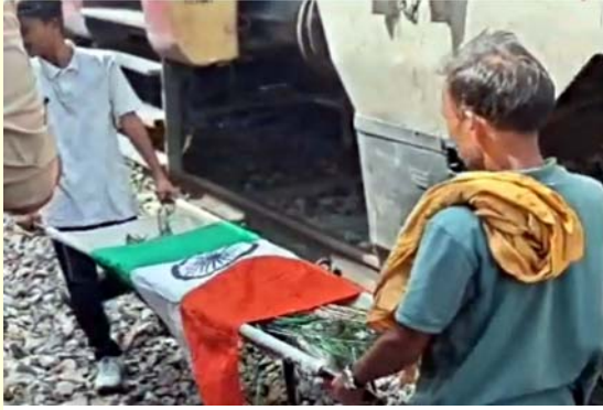
मृत मोर को तिरंगे में लपेटकर सम्मानपूर्वक ले जाया गया व पेंटो में फंसे मृत मोर को निकालते रेलवे कर्मचारी।

जानकारी के अनुसार, ट्रेन बराजपुर स्टेशन से कुछ दूरी पर थी तभी उड़ता हुआ मोर इंजन के पेंटोग्राफ से टकरा गया। टक्कर के बाद मोर पेंटो में फंस गया, जिससे ओवरहेड विद्युत लाइन से संपर्क टूट गया और ट्रेन की बिजली आपूर्ति बंद हो गई। अचानक सफ्लाई बाधित होने पर चालक ने ट्रेन रोक दी और मामले की