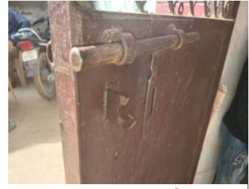
काटा गया मुख्य दरवाजे का कुंड़ा।