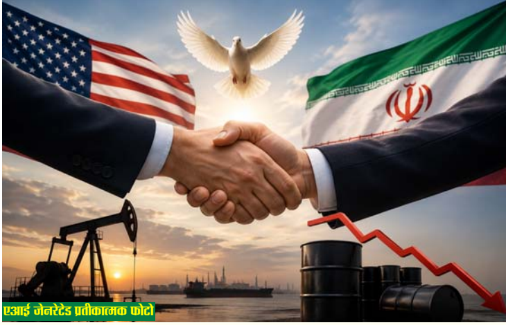
एआई जेनरेटेड प्रतीकात्मक फोटो

रिपोर्टों के मुताबिक, समझौते के तहत अमेरिका और ईरान कई चरणों में विश्वास बहाली के उपाय करेंगे। सबसे महत्वपूर्ण शर्त यह बताई जा रही है कि अंतिम दौर की व्यापक वार्ता तभी शुरू होगी जब ईरान को प्रारंभिक वित्तीय राहत मिल जाएगी, तेल प्रतिबंधों में ढील दी जाएगी और नौसैनिक नाकेबंदी समाप्त