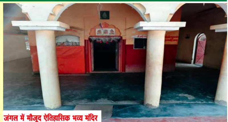
जंगल में मौजूद ऐतिहासिक भव्य मंदिर

जंगल के भीतर स्थित एक रहस्यमयी गुफा लोगों के बीच आज भी चर्चा का विषय बनी हुई है। कहा जाता है कि जो भी व्यक्ति इस गुफा में प्रवेश करता था, वह वापस नहीं लौटता था। सुरक्षा कारणों से प्रशासन द्वारा इस गुफा को बंद कर दिया गया है। समय के साथ यह स्थान ऋषि-मुनियों और साधु-संतों की तपस्थली बन गया। कई तपस्वियों ने यहां कठोर साधना कर सिद्धियां प्राप्त कीं। आज भी उनकी स्मृति में बनी समाधियां यहां मौजूद हैं, जो इस स्थान की आध्यात्मिक महत्ता को दर्शाती हैं। स्थानीय लोगों के अनुसार, महाभारत काल के बाद यहां एक सिद्ध बाबा भी आए थे, जिनकी कथाएं आज भी लोगों के बीच जीवित हैं। कहा जाता है कि बाबा का जीव-जंतुओं से अद्भुत लगाव था—एक शेर, एक मगरमच्छ और 'मथुरादास' नाम का बंदर उनके